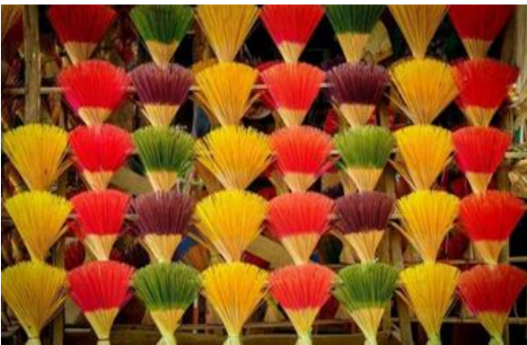
카오톤(Cao Thon) 전통 향 마을