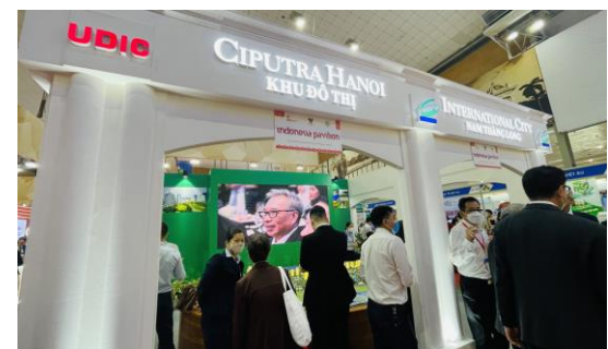
(왼)벨라루스관 전경, (오)인도네시아관 전경