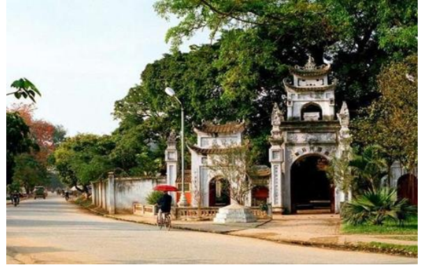
포히엔(Pho Hien) - 유명한 옛 무역항