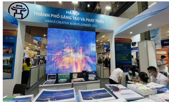
베트남 산업무역부 투자진흥청(VIETRADE)과 하노이시 투자무역관광진흥청(HPA) 홍보 부스