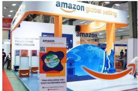
알리바바 및 아마존 글로벌 셀링 홍보 부스