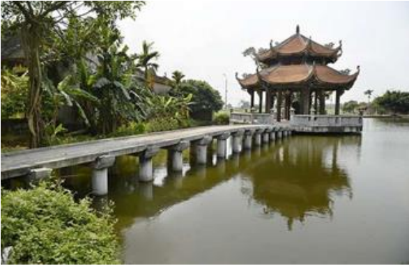
놈(Nom) 마을-베트남에서 가장 오래된 전통마을